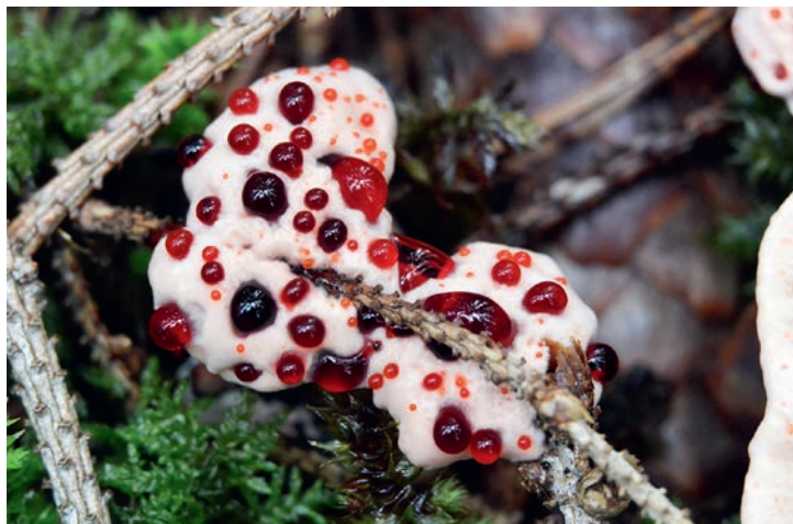
Droptaggsvamp finns i Hällestads-Torps naturreservat