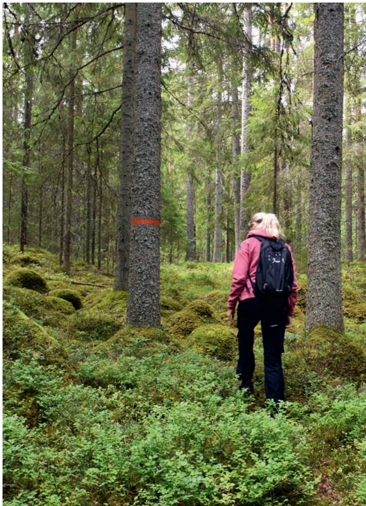
Hällestads-Torps naturreservat